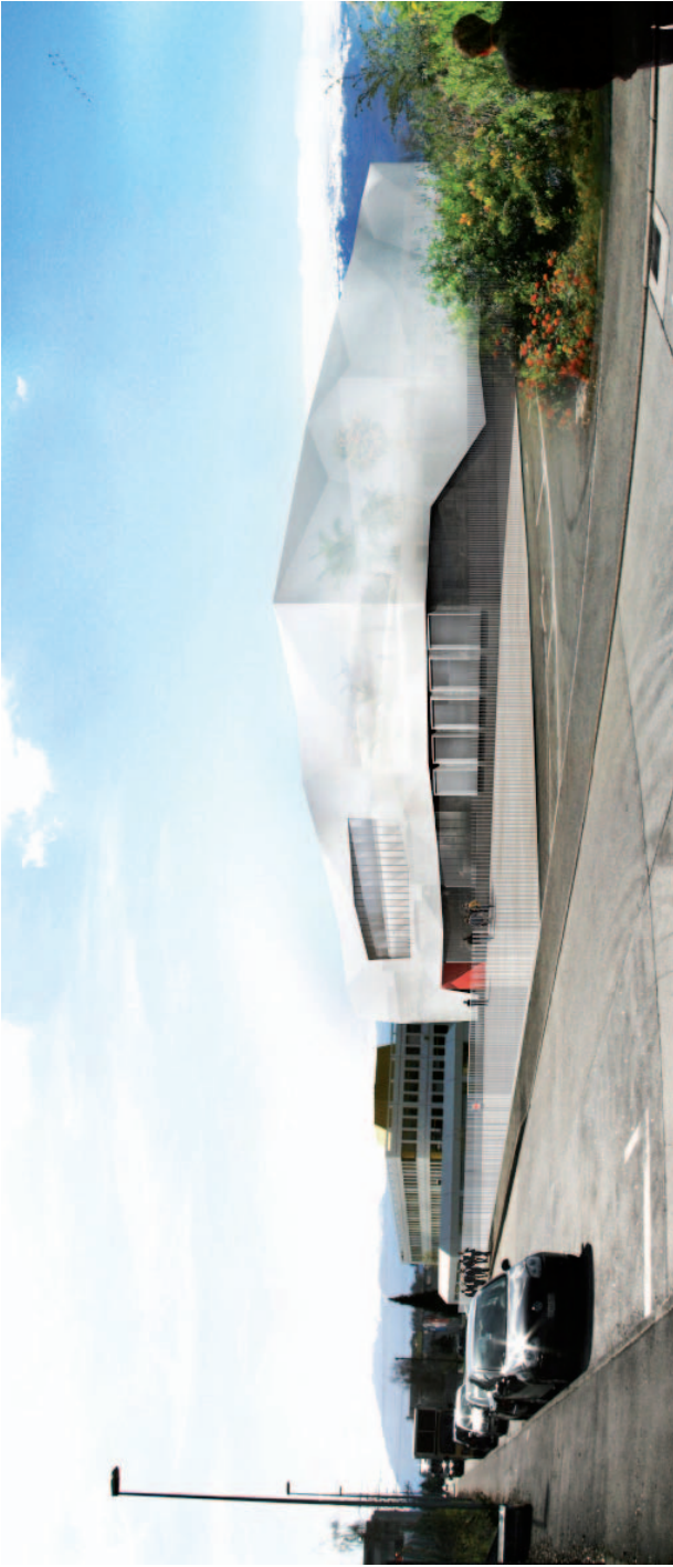
Image virtuelle de la nouvelle halle logistique