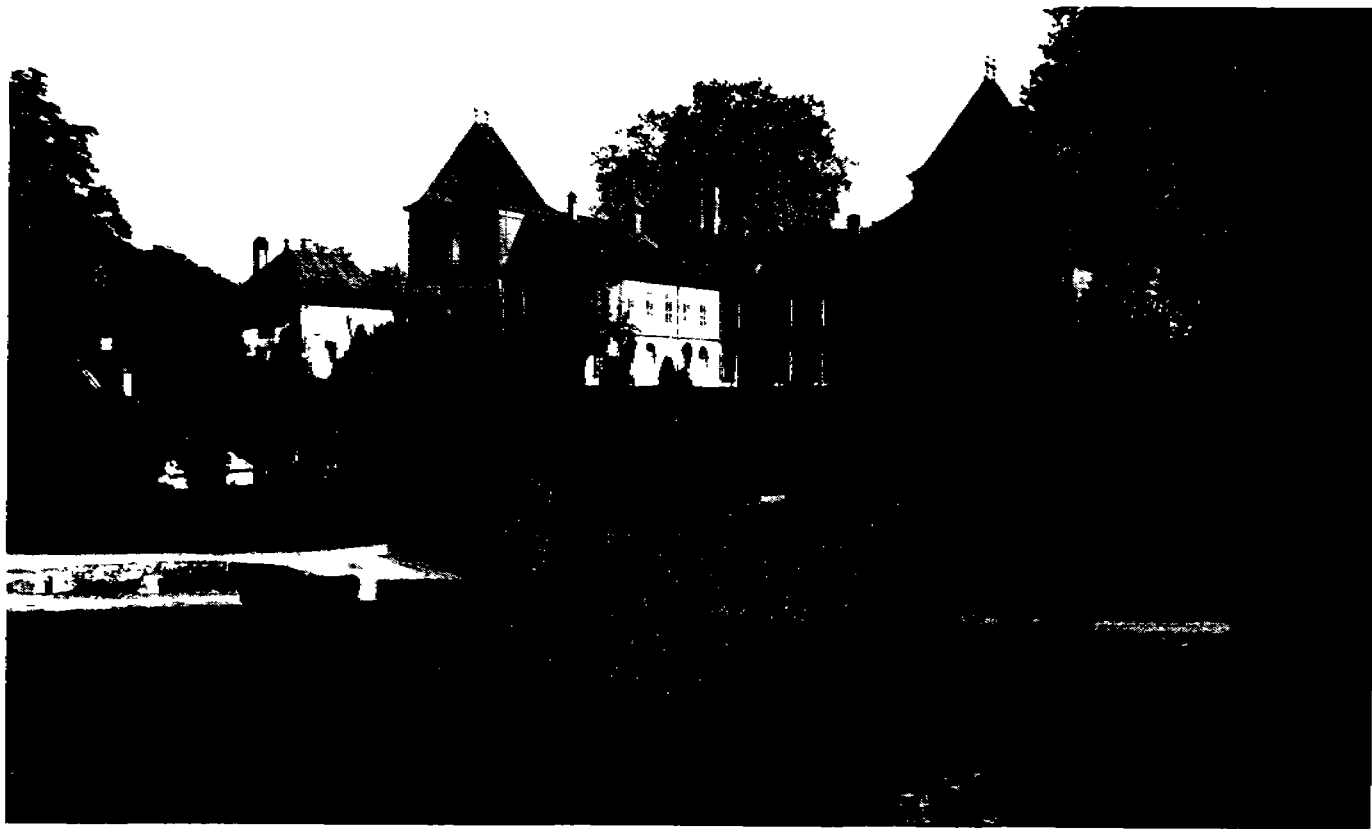
Château de Prangins vu du bourg, avec conciergerie, dépendance et jardin à la française