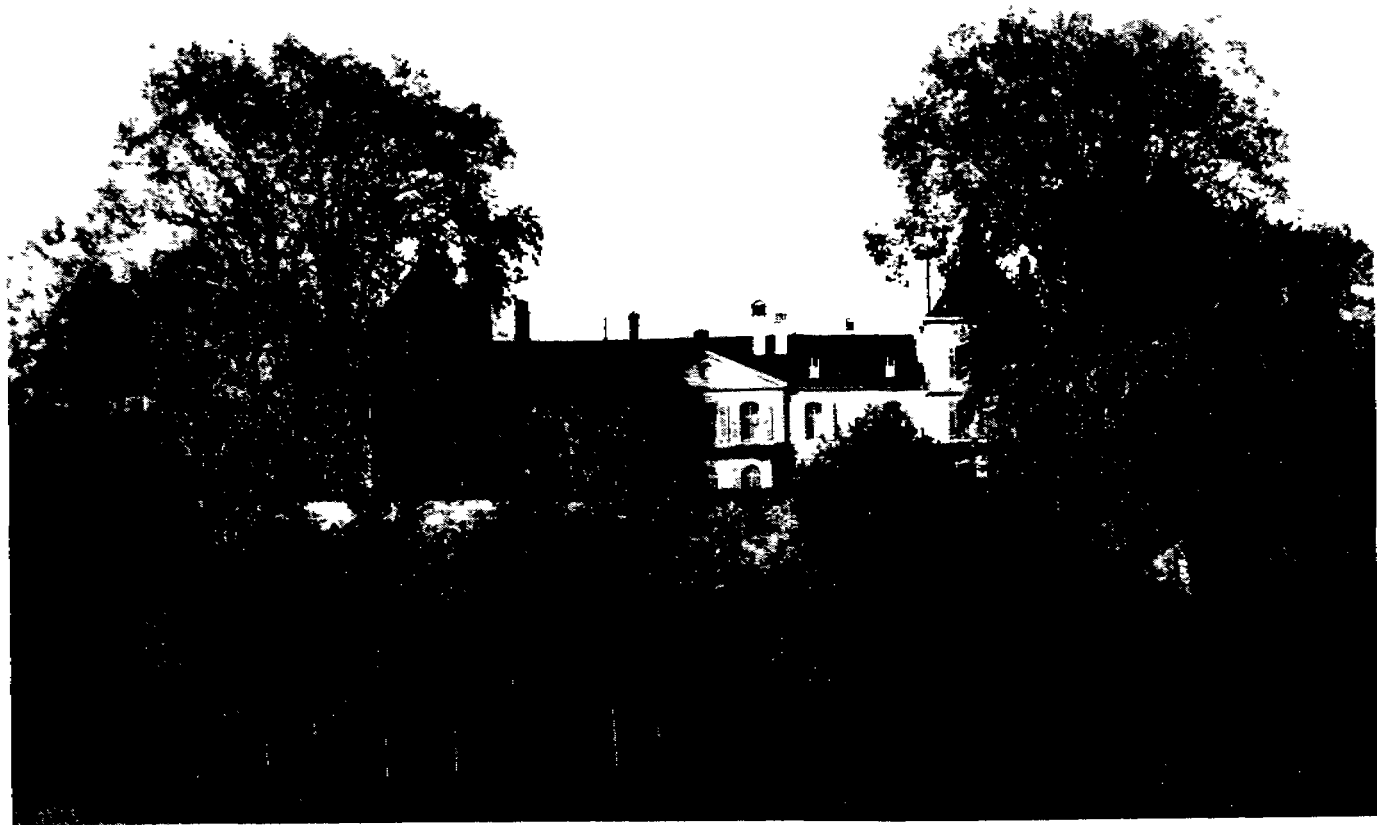
Château de Prangins vu du lac