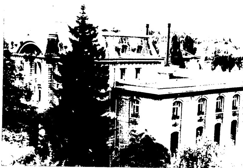
Vue prise de l'Aegertenstrasse