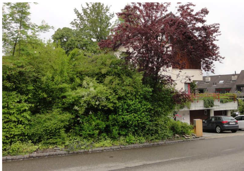
Zustand vor Erstellung der Mauer (16. Mai 2014)

a) Im Oktober 2018 erstellte A.____ entlang der südlichen Grundstücksgrenze eine etwa 1,2 m hohe und 21 m lange Mauer mit Mauersteinen aus Beton.