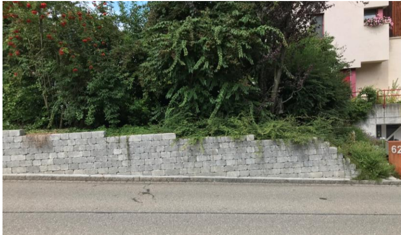
Zustand nach Erstellung der Mauer (24. August 2020)