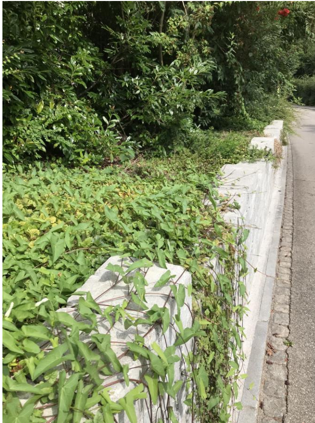
Bepflanzung im mittleren Bereich der Mauer

Entgegen der Ansicht des Rekurrenten ist es für die Beurteilung, ob nun eine Einfriedung oder eine Stützmauer vorliegt, unerheblich, wie hoch die Stützwirkung der Mauer genau ist bzw. ob ihr Fundament und ihr Anzug bautechnisch so konzipiert sind, dass sie auch in der Lage ist, die Kräfte aus der Böschung ausreichend aufzunehmen. Es ist jedenfalls aufgrund der vorhandenen baulichen Ausgestaltung der Anlage mit Erdhinterfüllung offensichtlich, dass bei einer Entfernung der Mauer Erdmaterial auf die Strasse abrutschen würde. Folglich kommt der erstellten Mauer klar eine Stützfunktion zu – unabhängig davon wie hoch diese nun konkret ist –, weshalb sie nicht als blosse, nicht hinterfüllte Grundstückseinfriedung, sondern eben als Stützmauer zu qualifizieren ist und den entsprechenden Strassenabstand von 0,5 m gemäss Art. 41 Abs. 2 Satz 1 BauO einzuhalten hat. Da dieser Abstand um 0,41 m unterschritten ist, fällt eine ordentliche Bewilligung der Anlage nicht in Betracht. Somit bleibt nachfolgend zu prüfen, ob für die Unterschreitung des Strassenabstands eine Ausnahmegewilligung erteilt werden kann.