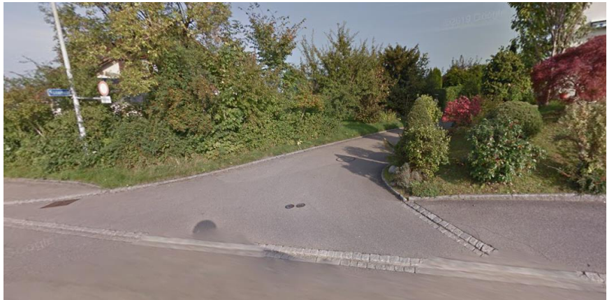
Einmündungsbereich der M. ___ in die N. ___ strasse mit unterbrochenem Trottoir