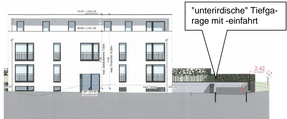
Ansicht Mehrfamilienhaus von der M. ___ aus

folgende Ansicht des umstrittenen Mehrfamilienhauses entnommen werden: