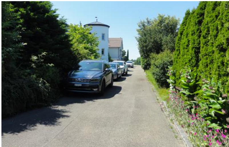
M.____ (Standort vor Baugrundstück Nr. 001, Blickrichtung Westen mit den parkierten Fahrzeugen der Augenscheinteilnehmer)

4.4 Am Augenschein bestätigte sich, dass das Baugrundstück Nr. 001 – wie die vier Einfamilienhäuser auf den Grundstücken Nrn. 009, 010, 007 und 003 – ab der N.____strasse (Gemeindestrasse 1. Klasse) über die M.____, eine rund 4,5 m breite, nicht ausparzellierte Gemeindestrasse 3. Klasse erschlossen ist. Die M.____ verläuft völlig gerade und eben; sie ist als Stichstrasse (ohne Wendeplatz und Ausweichstelle) ausgestaltet und weist bis zum östlich des Baugrundstücks liegenden Grundstück Nr. 003 eine Länge von etwa 95 m auf. Die Strasse wirkt optisch enger als sie es tatsächlich ist. Das liegt daran, dass üppige Bepflanzungen auf den beidseitig angrenzenden Grundstücken teils in das Lichtraumprofil der Strasse ragen. Die M.____ findet ihre Verlängerung in östliche Richtung (über das Grundstück Nr. 003) in Form eines Gemeindewegs 2. Klasse, den M.____weg.