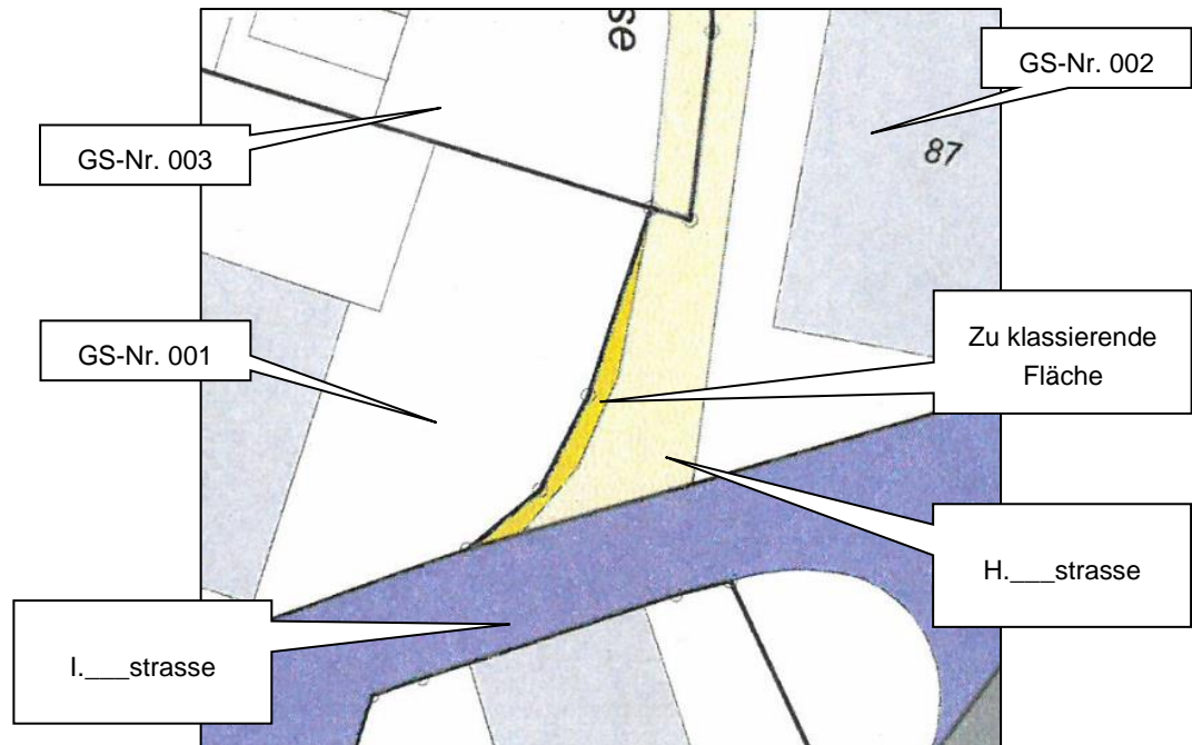
Abb. 1.: Teilstrassenplan H.___strasse (Ausschnitt)

b) Innert der Auflagefrist vom 12. November 2018 bis 11. Dezember 2018 erhoben A.___ und die Stockwerkeigentümergeinschaft B.___, beide vertreten durch lic.iur. Werner Rechsteiner, Rechtsanwalt, St.Gallen, Einsprache gegen den Teilstrassenplan. Sie bestritten, dass im Strassenplan aus dem Jahr 1991 der Strassenverlauf bis zur Grundstücksgrenze Nr. 001 eingezeichnet sein soll. Grund für die Klassierung sei vielmehr, dass die Eigentümerin des Grundstücks Nr. 001 im Jahr 2015 ein Baugesuch betreffend Abbruch Wohn-/Geschäftshaus und Neubau eines Mehrfamilienhauses eingereicht hatte. Im drauffolgenden Rechtsmittelverfahren hätten die Einsprecher gerügt, dass das Grundstück Nr. 001 lediglich über die I.___strasse, nicht aber über die H.___strasse erschlossen sei. Das Baudepartement habe die Baubewilligung letztlich verweigert. Mit dem vorliegenden Teilstrassenplan sollte dieser Mangel nun behoben werden.